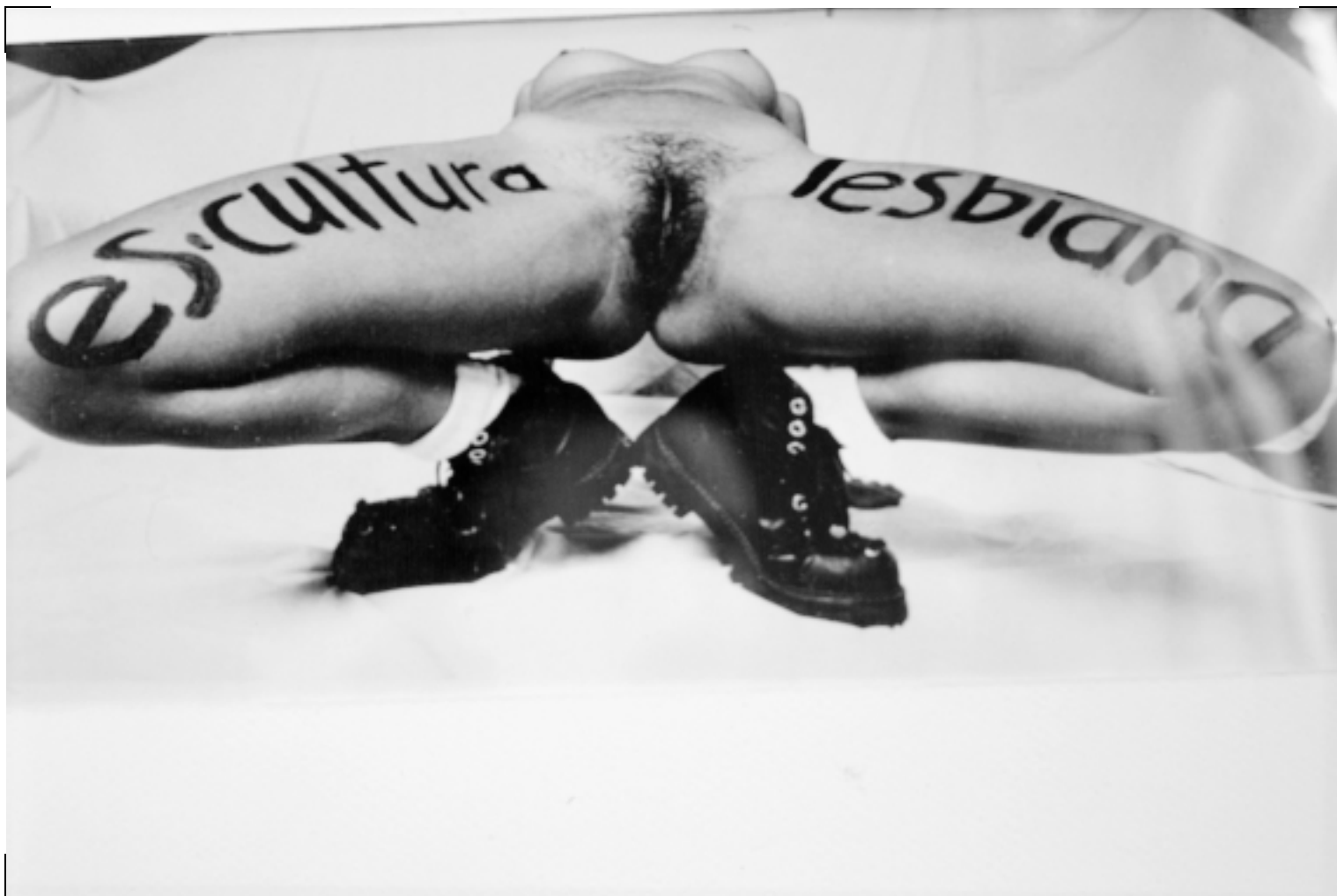
LSD Es cultura lesbiana 1994