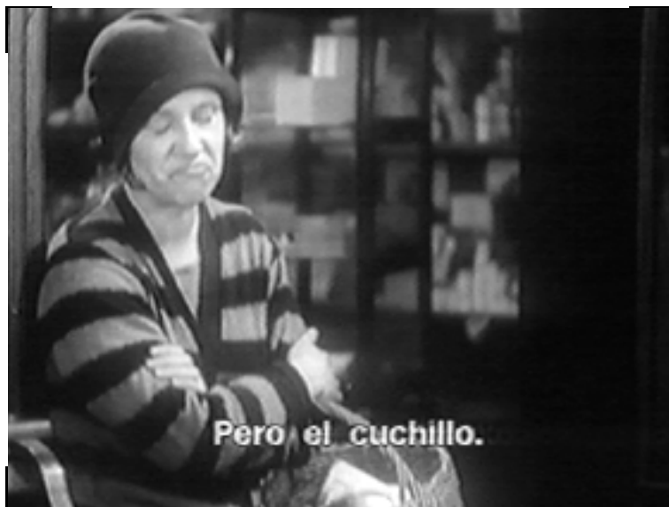
Alfred Hitchcock La muchacha de Londres 1929

DEBEMOS asumir POR ELLO QUE LA OBRA DE ARTE PUEDE SER ALGO QUE SURGE EN CUALQUIER PARTE Y POR MEDIO DE CUALQUIER COSA. SU ARTISTICIDAD NO radica EN EL PROCEDIMIENTO UTILIZADO, SINO EN SU PARTICULAR MODO DE INCIDIR EN NUESTRA MANERA DE concebir EL MUNDO Y RELACIONARNOS CON ÉL.