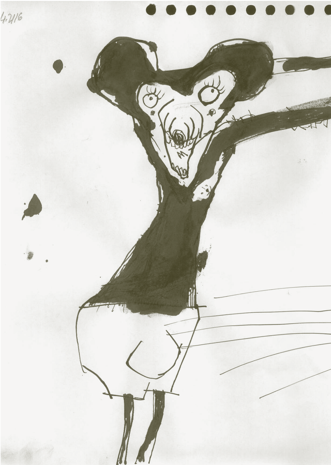
↑ Hezurbeltzak, Izibene Oñederra, 2007.