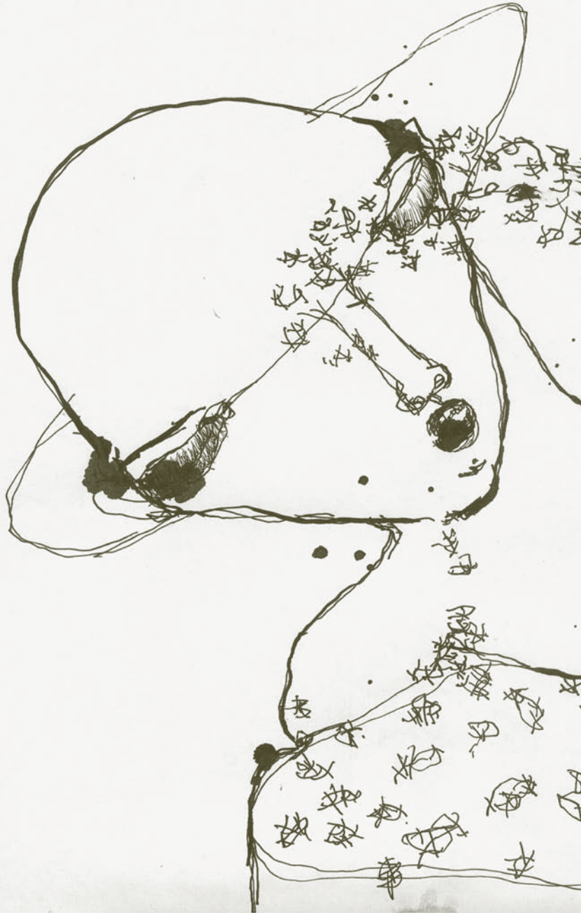
↑ Hezurbeltzak, Izibene Oñederra, 2007.