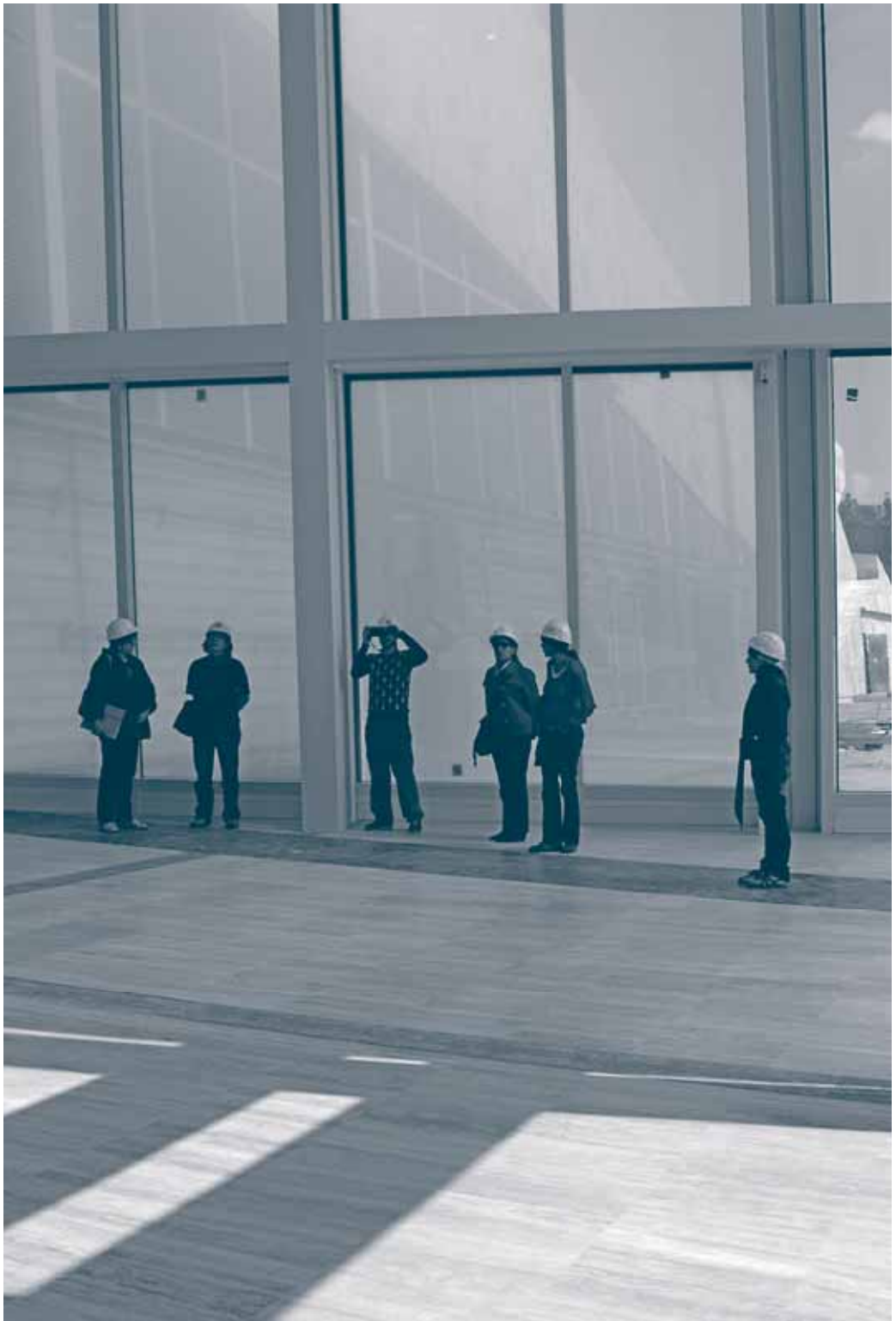
↑ Apolonija Šušteršič.