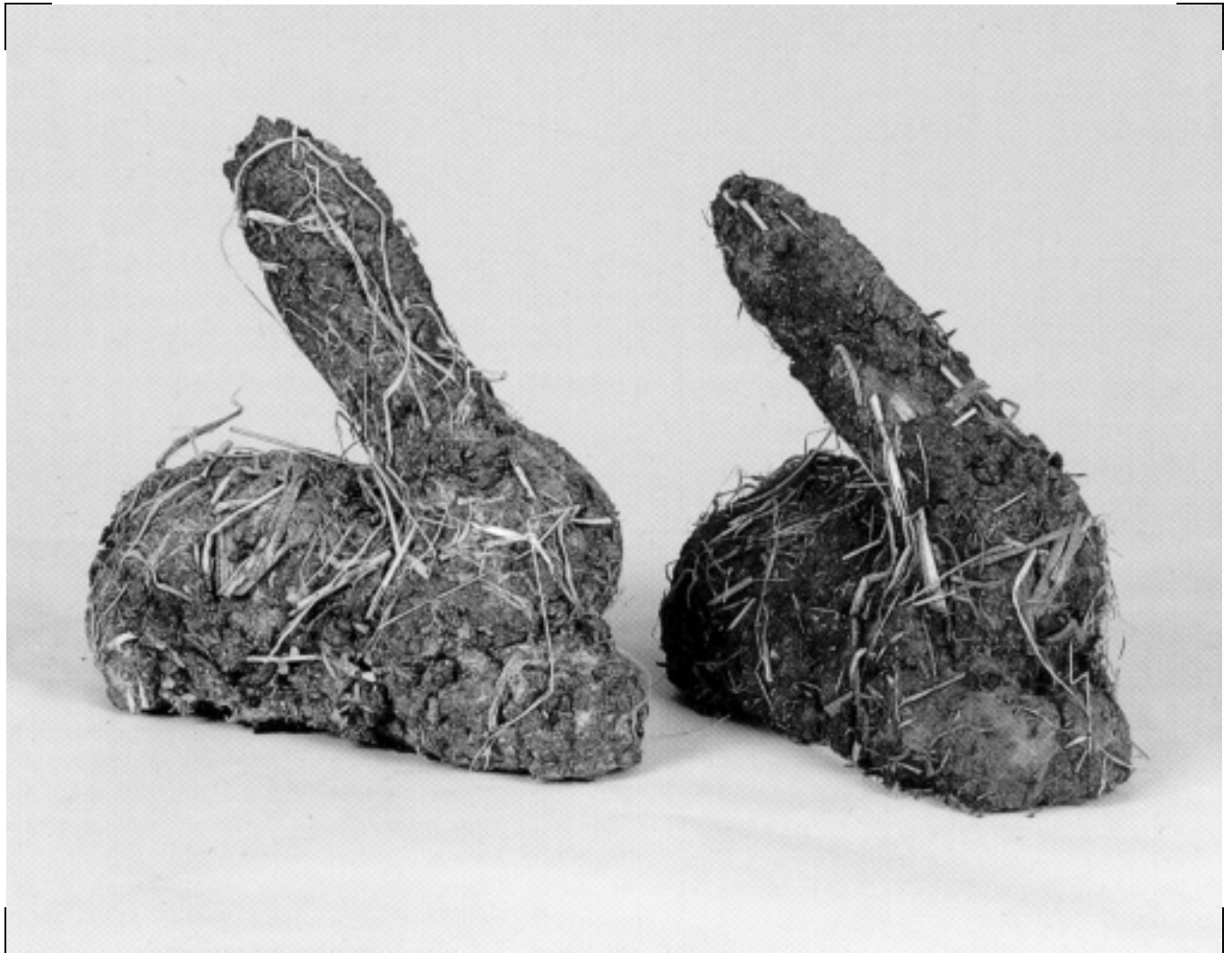
Dieter Roth Kottelkarinickel 1969/91-1972/87

Gorozki ERREFERENTZIEK ARTE ESKATOLOGIKOAN LUZARO ADIERAZI IZAN DUTE AGINTEAREN ETA JABEGO BURGESAREN AURKAKO matxinada (ADIB., JAMES ENSOR-EN LANEAN), BAINA GAUR EGUNGO ARTISTAK EZ DIRA GOROZKIAK IRUDIKATZERA MUGATZEN, BEREN LANEAN ERABILI EGITEN DITUZTE bitarteko MODUAN.